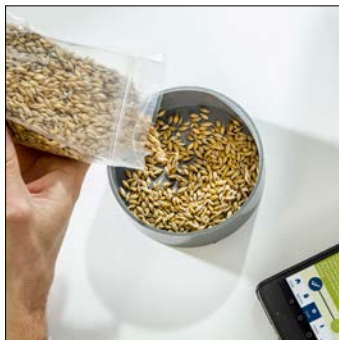
5. Remplissez un récipient de fourrage