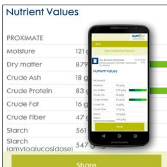
9. Contrôlez les valeurs nutritionnelles du fourrage