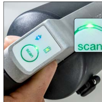
7. Attendez que le scan soit terminé