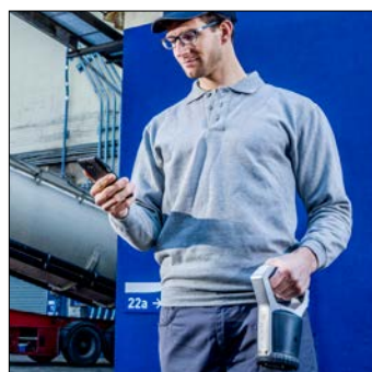
10. Adaptez votre gestion du fourrage