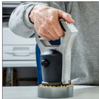
6. Appuyez sur 'Scan'