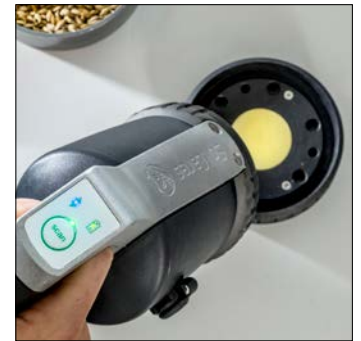
4. Calibrez le scanner